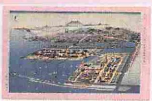
複製版「紀元二千六百年記念日本万国博覧会」(金田正太郎編)

●懸賞競技設計図集等の各種図面や、各地で開催された博覧会の写真等、図版資料も豊富に掲載。また海外向けに作成されたパンフレット等も別冊に収録し、日本のイメージや観光において日本がどのような国家的戦略を有していたかも見えてくることが可能である。